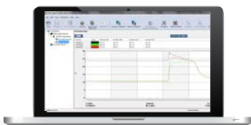
Data Logger Transfer Automatische Erstellung von Berichten